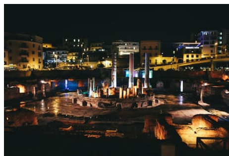
Le port de Pouzzoles et les vestiges du macellum